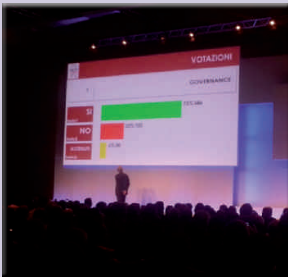
Congresso Straordinario - votazioni

E' quindi indispensabile continuare a lavorare su questa materia, se vogliamo veramente essere all'altezza di ricoprire quel ruolo di attori fondamentali della ns. società.