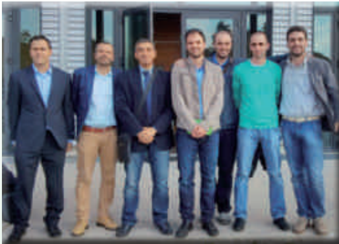
Incontro pregressuale ad Arezzo 4/10/2014 - Delegati