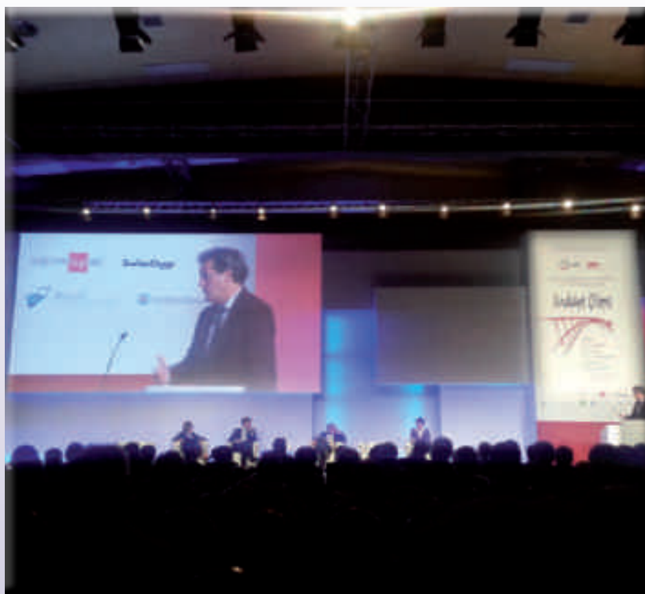
Congresso Straordinario - un momento della prima giornata

Su argomenti come questi non ci devono essere tentennamenti, dubbi; dobbiamo essere degni del ns. ruolo.