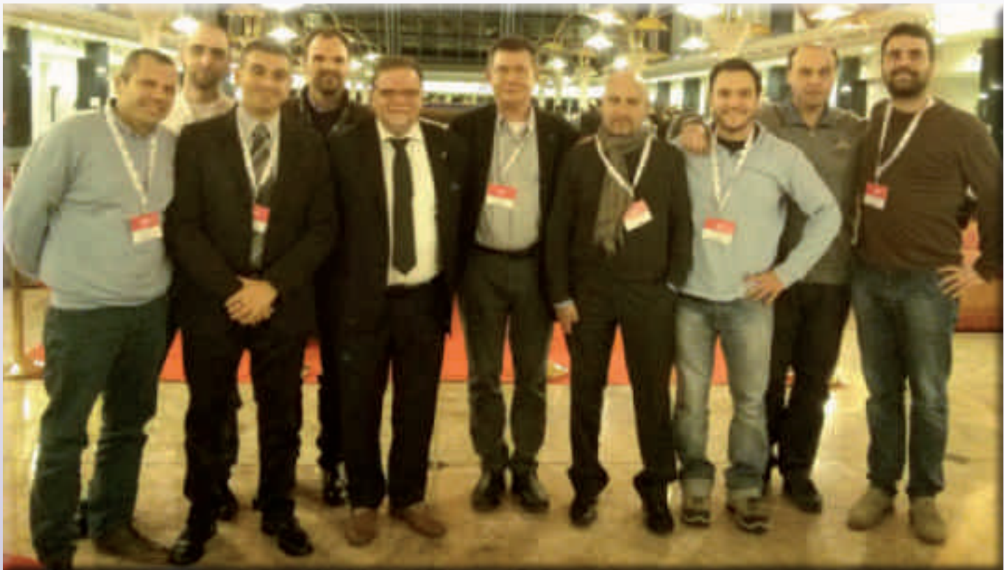
Congresso Straordinario - I delegati con il Presidente CNPI

Parlare di progettazione può sembrare di voler limitare il discorso alle sole professioni di area tecnica, a quelle che, nel pensiero comune, vengono interpellate per redigere un "progetto".